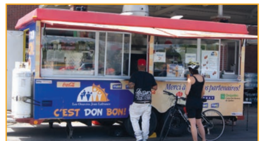
L'ancienne roulotte des Œuvres Jean Lafrance, avant l'arrivée du camion de cuisine de rue, en 2016.