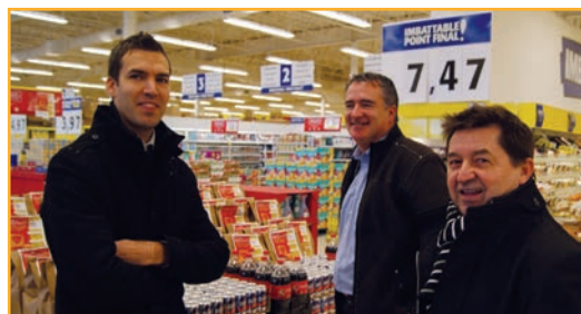
Le Magasin Partage se tenait dans certains supermarchés Maxi de la région de Québec.