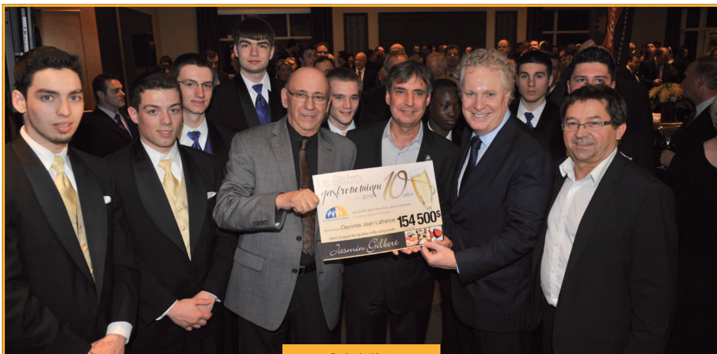
Remise du chèque

Ensemble, nous pouvons offrir à ces jeunes une chance de s'épanouir et de repartir du bon pied sur un nouveau chemin